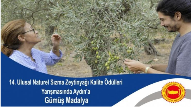
14. Ulusal Naturel Sızma Zeytinyağı Kalite Ödülleri Yarışmasında Aydın'a Gümüş Madalya

Zeytindostu Derneği'nin 14. Ulusal Naturel Sızma Zeytinyağı Kalite Ödülleri yarışmasına 'Março' adıyla markalaştırdığı natürel zeytinyağı ile katılan anne-oğul gümüş madalya sahibi oldu.